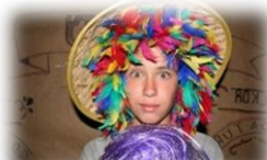
Animación y talleres