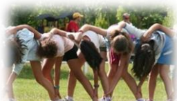
Viajes de 3 a 7 días