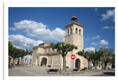
Plaza de Boñar